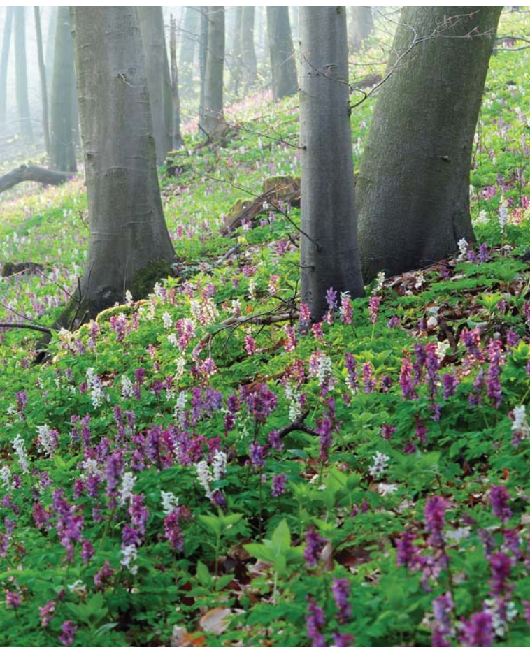
Einer von 92 Lebensraumtypen, die in FFHG-Gebieten zu schützen sind: Waldmeister-Buchenwald

Die Versäumnisse kommen nicht von ungefähr. Jahrelang beteuerten Länderumweltminister gegenüber der Wirtschaft, einer Unterschützstellung oder der Anpassung alter Schutzgebietsverordnungen bedürfe es nicht. Wenn in den gemeldeten Gebieten eine drohende Verschlechterung abgewendet oder eine Verbesserung erreicht werden müsse, dann auf freiwilliger Basis mit Geldzahlungen an die Grundeigentümer. Diese haben das gerne gehört und geglaubt. Behörden, die für die Unterschützstellung von Gebieten zuständig waren, wurden teils aufgelöst, geschwächt und selten personell gestärkt oder Entscheidungsbefugnisse auf die kommunale Ebene geschoben. Im Jahr 2000 resümiert die Gesellschaft zur Erhaltung der Eulen: „In Deutschland fehlt es nicht allein an der Meldemoral. Kaum eine Landesregierung denkt daran, die künftigen Natura 2000-Gebiete konsequent zu schützen. Denn erst nach Aufnahme der Gebiete in das Netz beginnen die Herausforderungen. Stattdessen sollen alte Verordnungen und freiwillige Vereinbarungen den gemeinschaftsrechtlichen Anforderungen genügen – bis zur gerichtlichen Korrektur.“