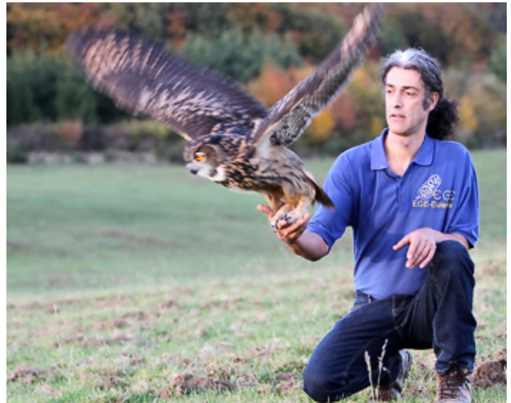
Geheiltes Uhu wird in die Freiheit entlassen

Ihre Spende ist stets willkommen. Gerne senden wir Ihnen zur Vorlage beim Finanzamt eine Spendenbescheinigung. Wie Sie wissen, zahlen wir uns keine Gehälter, sondern jeder Euro fließt in die Projekte zum Schutz der Eulen. Der beigefügte EGE-Jahresbericht 2015 zeigt Ihnen, wie wir Ihre Spende im zu Ende gehenden Jahr eingesetzt haben.