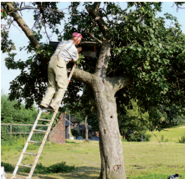
Die Nisthilfen werden regelmäßig kontrolliert.

bergehend leer, andere werden erst nach Jahren angenommen. Im Kreis Düren mildern vor allem die EGE, die Biologische Station und im östlichen Kreisgebiet eine Arbeitsgruppe der katholischen Pfarrei Buir die Wohnungsnot der Käuze auf diese Weise. Die Naturschützer sind dabei auf das Einverständnis und die Mithilfe privater Grundstückseigentümer angewiesen. Zurzeit hängen im Kreis Düren etwas mehr als 200 Steinkauznistkästen. Die meisten werden von Mitarbeitern der EGE regelmäßig kontrolliert und gewartet. Im Herbst oder Winter sind Reparaturen fällig. Manchmal haben sich Spechte an den Kästen zu schaffen gemacht, einige haben Marder zerkratzt, manchmal ist der Ast, auf dem sie lagen, abgebrochen oder der Baum vom Sturm umgeworfen.