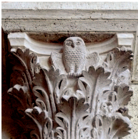
Kauz auf einem Kapitell einer romanischen Kirche in Burgund

Der Kauz verdient die Zuneigung des Menschen. Er ist ein allerliebstes Geschöpf“, schrieb Alfred Brehm 1892 in seinem Tierleben. Im Rheinland kannte früher jedes Kind den Steinkauz. Zehn oder mehr Brutpaare in einem Dorf waren keine Seltenheit. Heute lebt in vielen Dörfern kein einziger Steinkauz mehr. Der Verlust an Lebensraum macht ihm zu schaffen. Naturschützer im Kreis Düren setzen sich für den Schutz der kleinen Eule und den Erhalt ihres Lebensraumes, einer historischen Kulturlandschaft, ein.