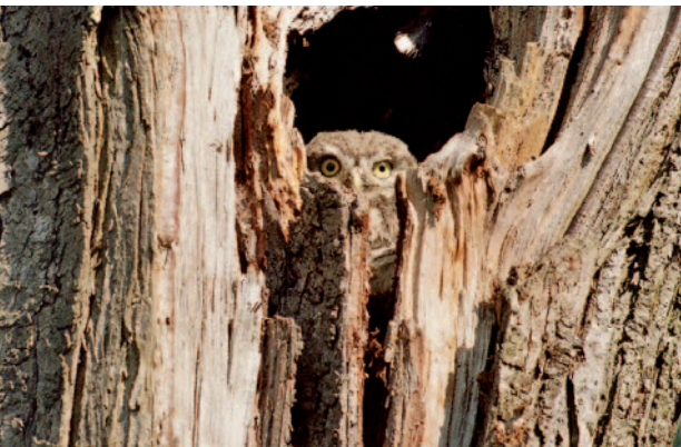
Steinkauz in einer natürlichen Baumhöhle

garten. Die meisten Menschen freuen sich jedoch über die kleine Eule, nicht nur, weil sie Mäuse fängt. „Wenn der Kauz im Apfelbaum sitzt, das ist doch einfach zu schön“, so oder so ähnlich hören es die Naturschützer immer wieder. Heute ist der Steinkauz als Sympathieträger das Symboltier für eine artenreiche Kulturlandschaft, in der auch zahlreiche andere gefährdete Vogelarten wie Grünspecht und Gartenrotschwanz zu Hause sind.