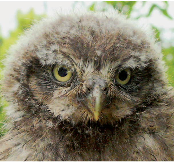
Junger Steinkauz

garten. Die meisten Menschen freuen sich jedoch über die kleine Eule, nicht nur, weil sie Mäuse fängt. „Wenn der Kauz im Apfelbaum sitzt, das ist doch einfach zu schön“, so oder so ähnlich hören es die Naturschützer immer wieder. Heute ist der Steinkauz als Sympathieträger das Symboltier für eine artenreiche Kulturlandschaft, in der auch zahlreiche andere gefährdete Vogelarten wie Grünspecht und Gartenrotschwanz zu Hause sind.