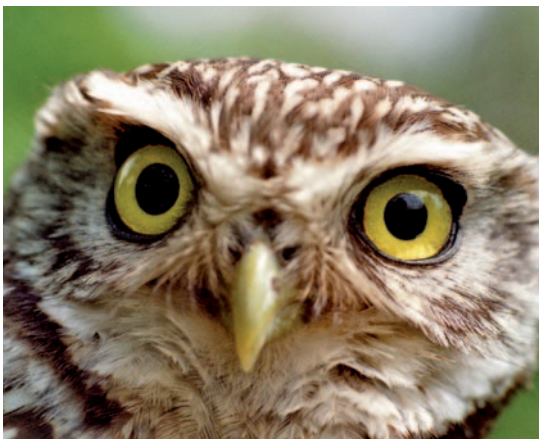
Der alte Kauz aus Thuir