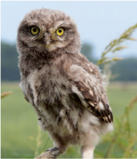
Beringter junger Steinkäuz

Mit der Beringung und der Wiedermeldung beringter Käuze erhalten die Naturschützer einen Überblick über den Bruterfolg, die Brutplatz- und Partnertreue, die Familienverhältnisse, die Altersstruktur und die Ausbreitung der Vögel. Mehr als die Hälfte der jungen Käuze siedelt sich im Umkreis von weniger als zehn Kilometern um den Brutplatz an.